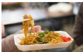
やきそば fried noodles