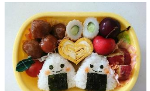
お弁当 lunch box