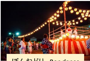
ぼんおどり Bon dance